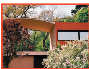
Cité Frugès - Le Corbusier